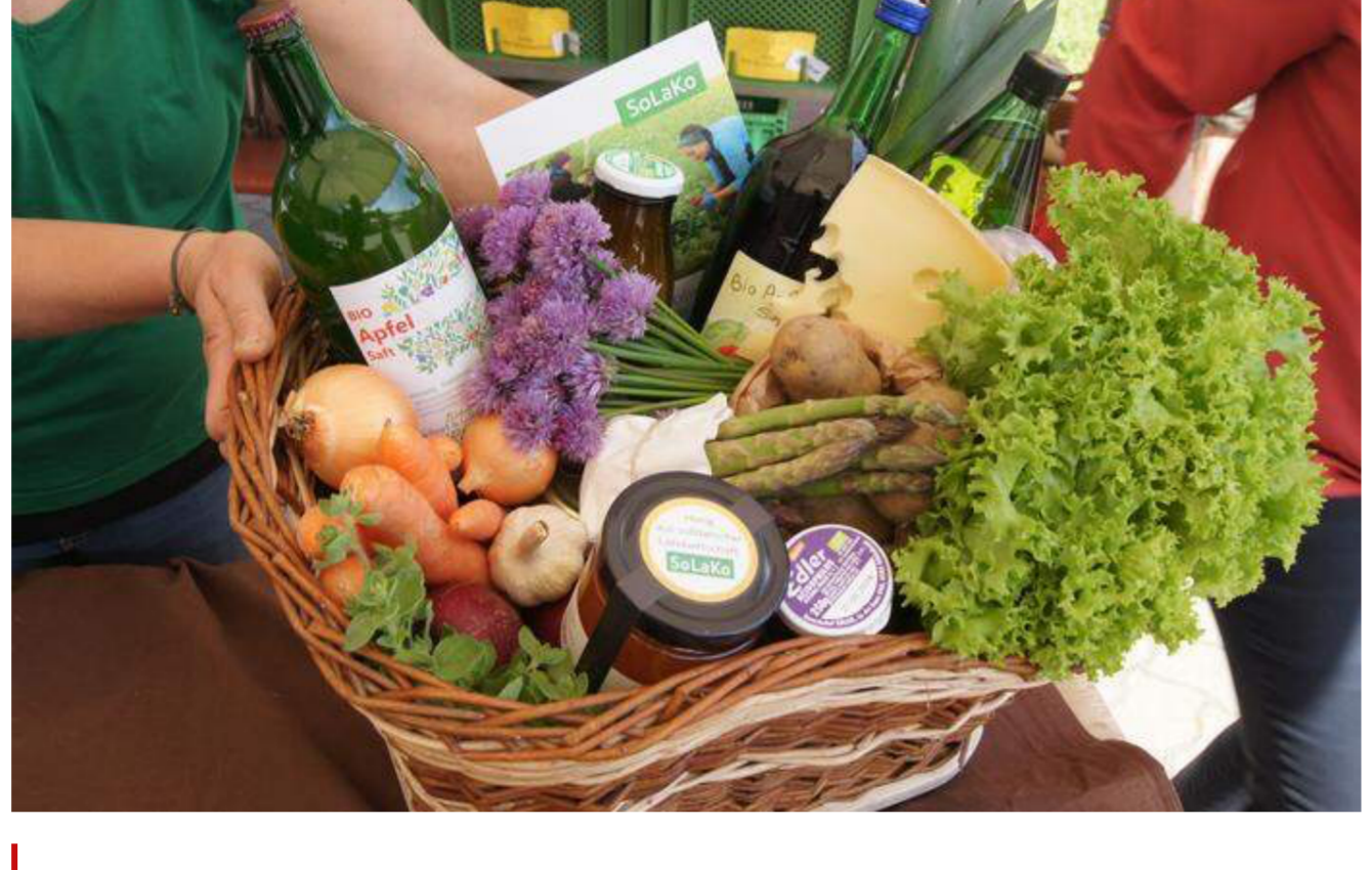
Obst, Gemüse und Honig: All das findet sich im Solako-Korb