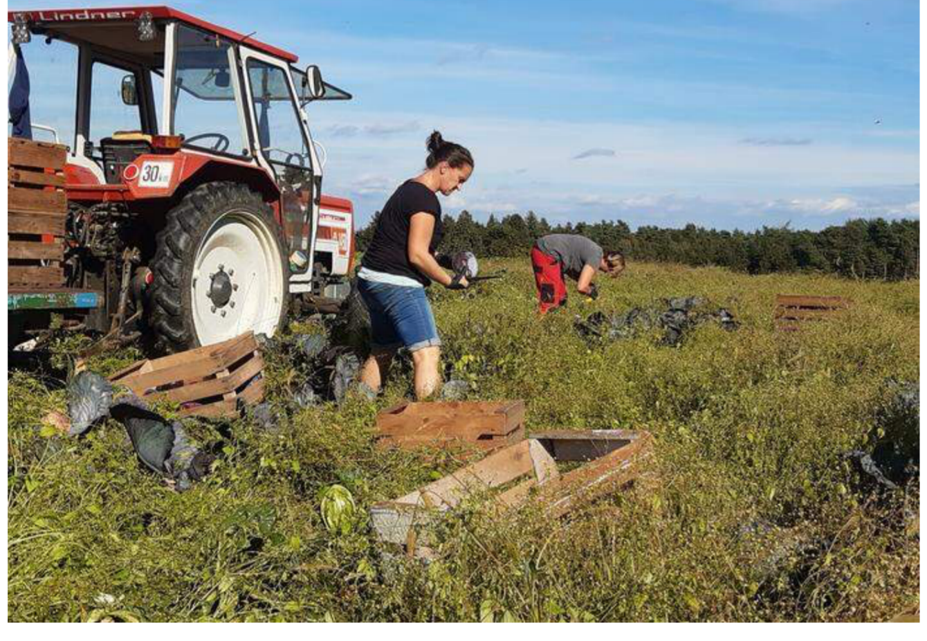
Insgesamt gibt es in Österreich rund 60 solidarische Landwirtschaftsprojekte, das Modell mit fünf Betrieben wie in der Steiermark ist jedoch österreichweit einzigartig.

Diese fixierte Einkunft ist für die Höfe eine Entlastung und ermöglicht ihnen das, was viele landwirtschaftliche Betriebe aktuell schmerzlich vermissen: Planungssicherheit. „Für die Solako-Bauern wird somit der finanzielle Druck geringer.“ Aber auch im Umkehrschluss ist das Modell bereichernd für die Haushalte: Sie erhalten auf Nachfrage detailliertes Wissen über die Produktionskette, bekommen Einblicke hinter die bäuerlichen Kulissen und können sich in Workshops oder Infoveranstaltungen weiterbilden. „Zudem ist es auch möglich, bei den Betrieben aktiv mitzuhelfen, wenn man das möchte“, erklärt Minutillo, die als Sprecherin der Kooperative fungiert. Daher reden die Familien auch nicht von Produkten, sondern von „Anteilen“, sie sind nicht Kunden, sondern „Teilhaber“. Minutillo: „Wir stecken zusammen mit drin. Wenn es schlechter läuft und es Ernteausfälle gibt, nehmen wir das in Kauf, weniger zu bekommen. Und wir setzen uns dafür ein, dass es lieferfreie Zeiten gibt und die Bauern sich eine Auszeit nehmen.“